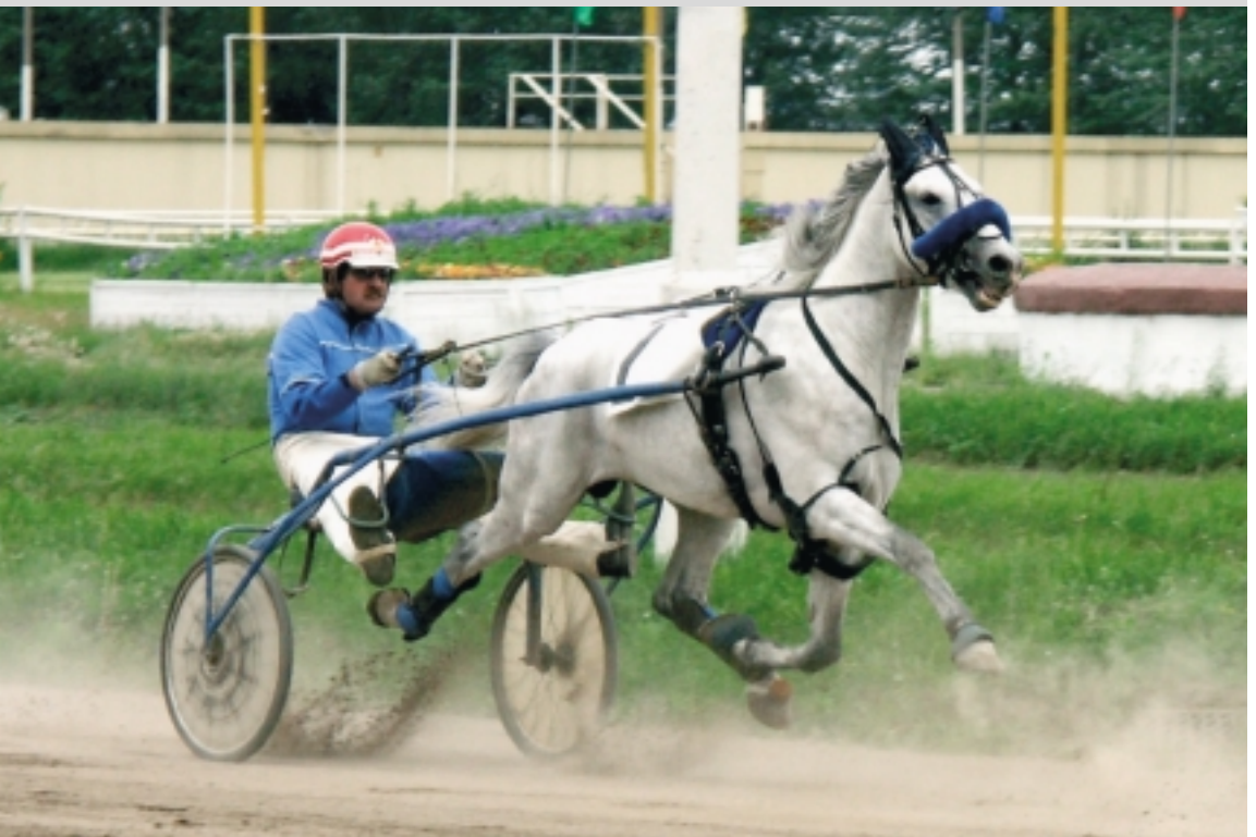
Канюк 2.10,2 (Ковбой – Камея) – сер. жер. 2001 г.р. Победитель приза «Барса» на ЦМИ (2005).