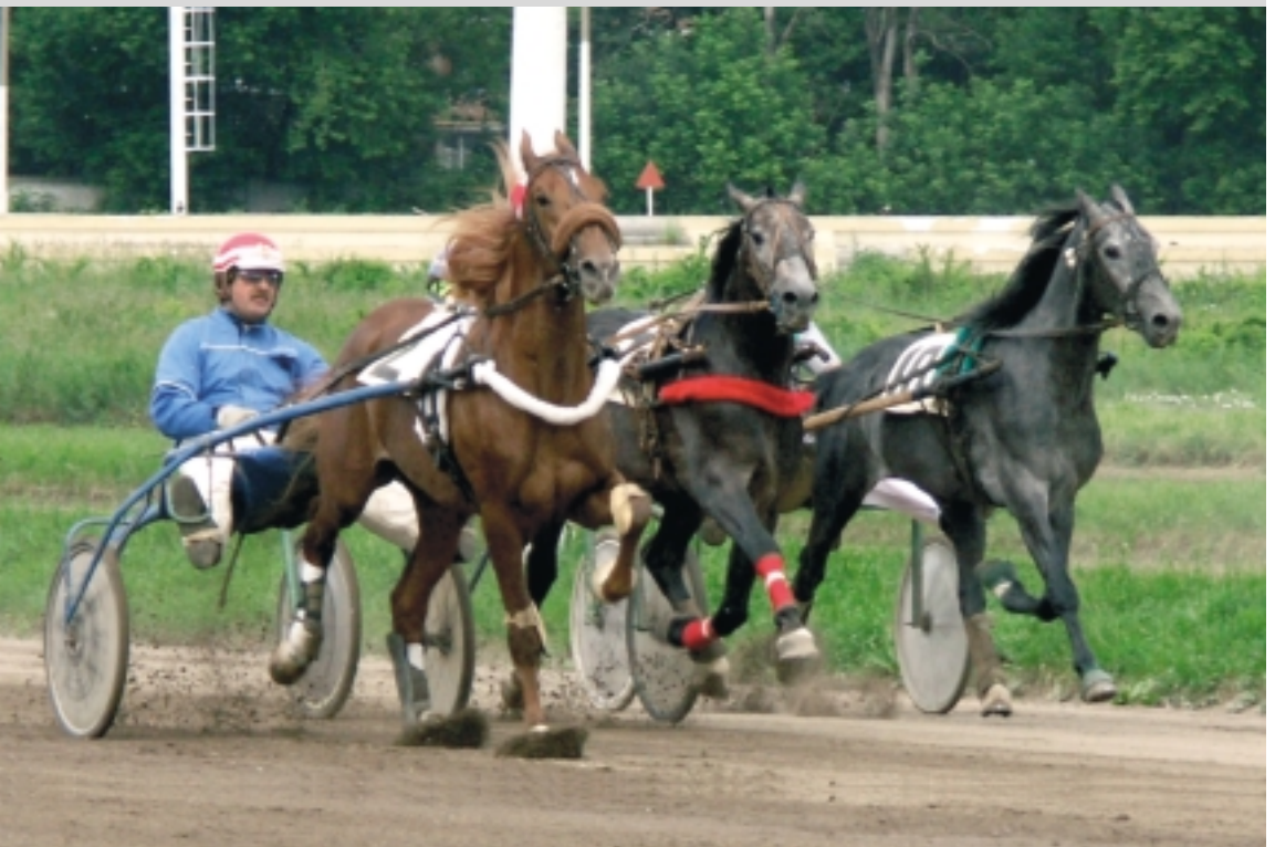
Колокол 2.12,2 (Кипр – Кабала) – св.-рыж. жер. 2002 г.р. Победитель Большого 3-х летнего орловского приза на ЦМИ (2005).